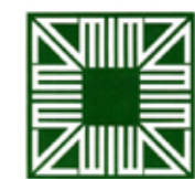
The Aga Khan Award for Architecture 2007