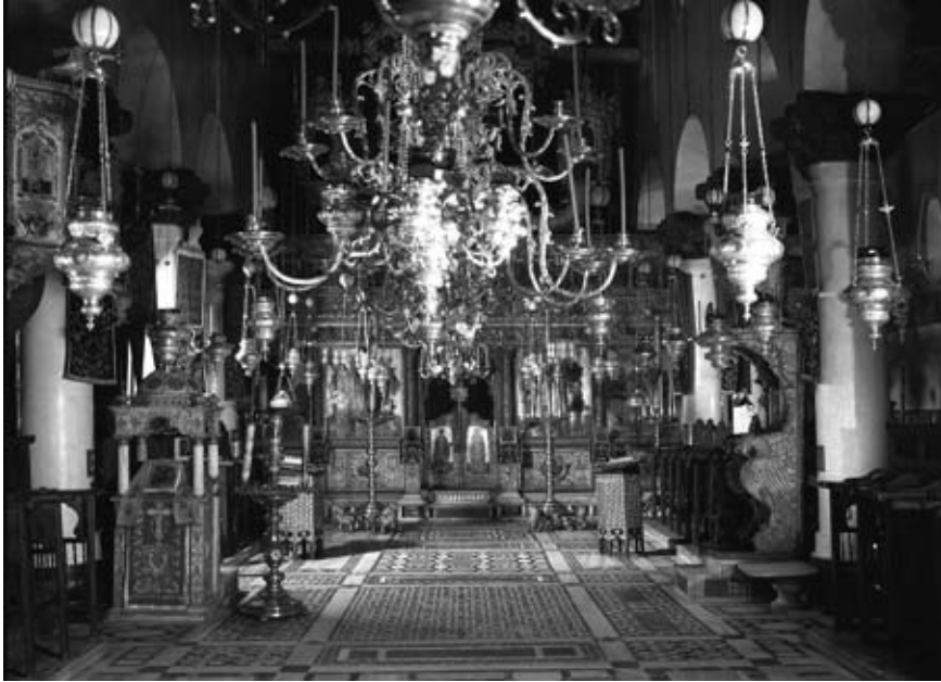
6. L'intérieur de l'église du Monastère de Sainte Catherine