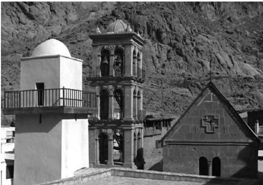
5. L'église et son clocher et le minaret de la mosquée vus du Monastère de Sainte Catherine