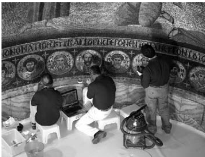
14. Vue d'ensemble des conservateurs-restaurateurs travaillant sur la mosaïque de l'abside

L'intervention de conservation sera longue et délicate; elle sera achevée en 2007. La mosaïque de la Transfiguration restituée pourra être à nouveau admirée et révérée par les moines, fidèles et visiteurs.