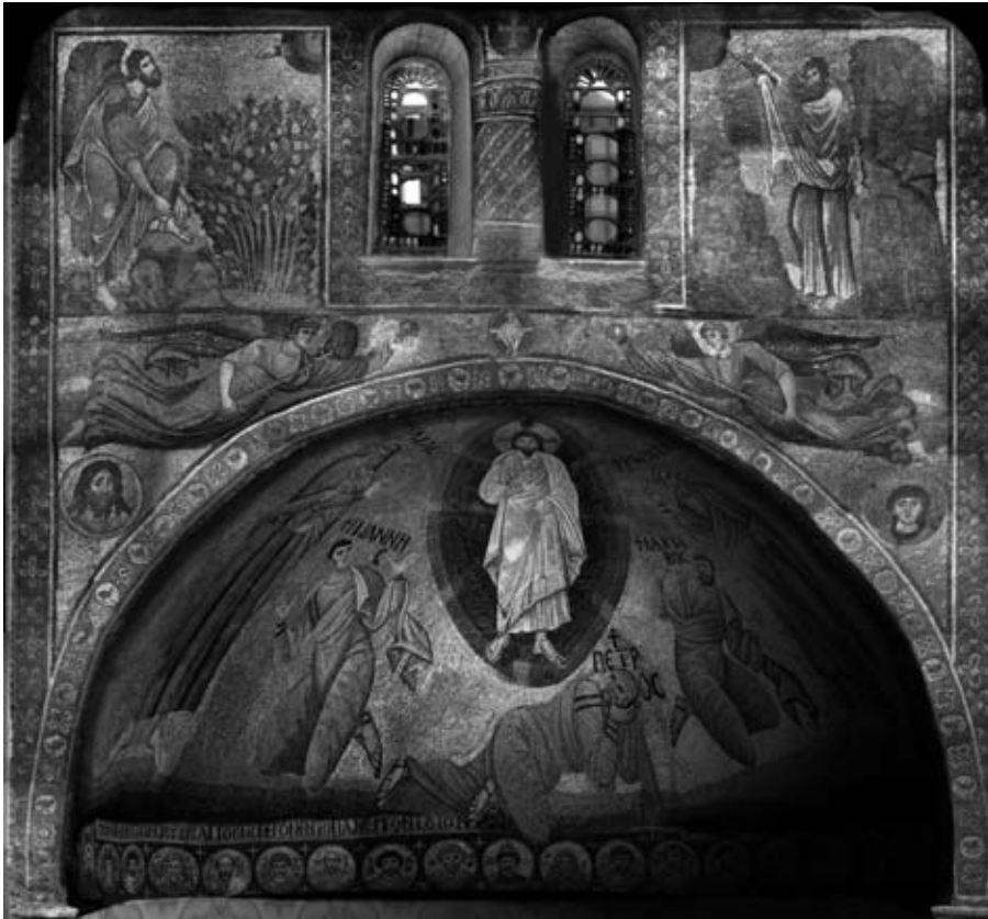
8. La mosaïque de la Transfiguration: l'abside et l'arc

Plus de trente couleurs composent la palette de tesselles de verre dans une riche gamme de nuances de ton : les verts, bleus, turquoise, violets, rouges, jaunes, marrons, noirs, gris et blancs. Elles sont utilisées pour réaliser les figures plus grandes que nature d'Elie, Moïse, Jean, Pierre, qui se découpent sur fond d'or de l'abside, et