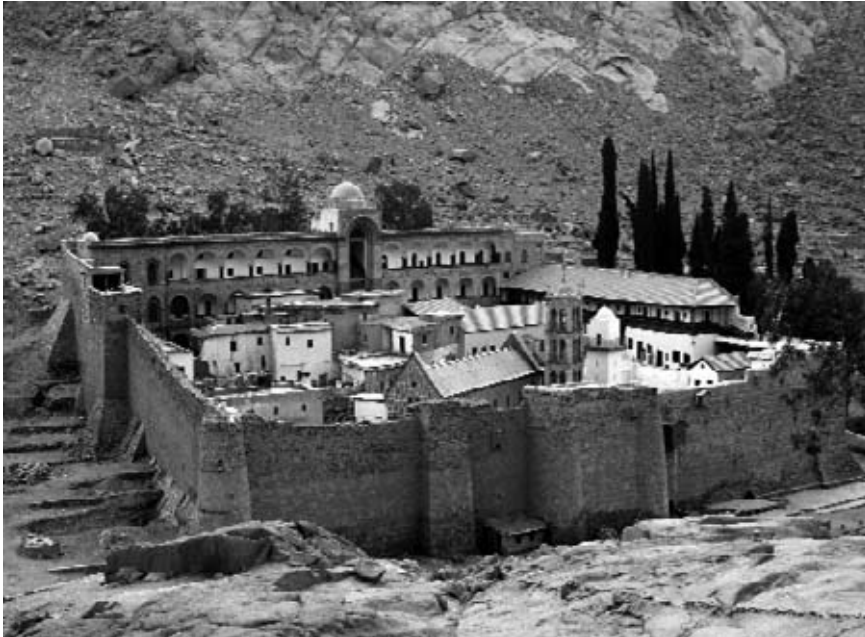
4. Le Monastère de Sainte Catherine