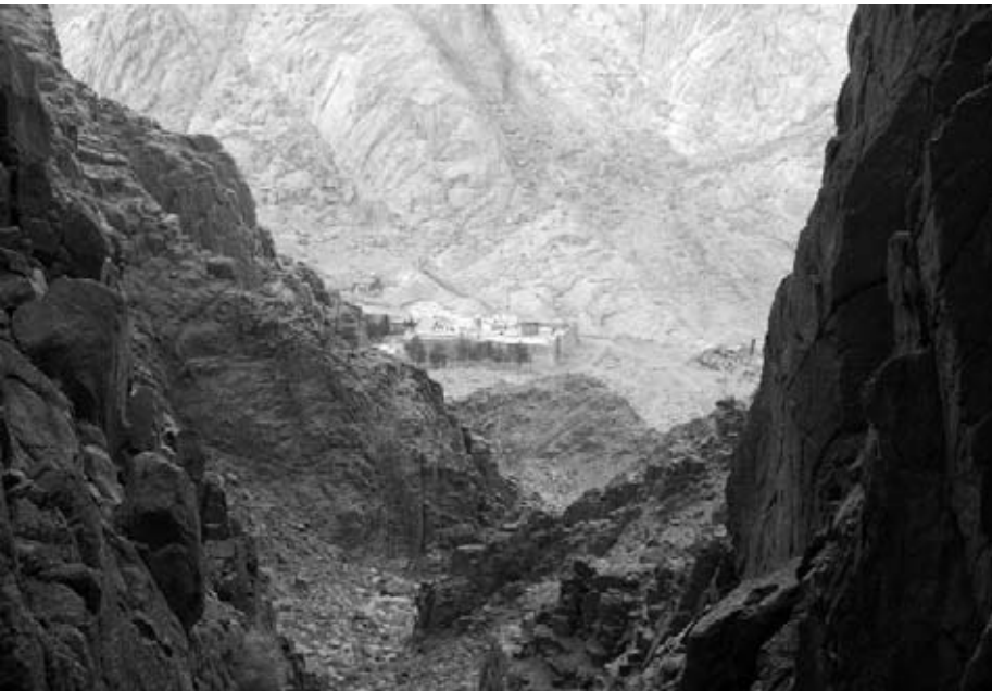
3. Le Monastère de Sainte Catherine vu du chemin qui descend du Mont Sinaï.