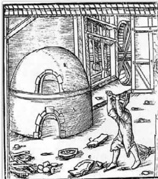
10. Four pour la fonte du verre, image du XVIème siècle (Agricola 1556)

Cette dernière, était étalée en portions correspondant à ce qu'un mosaïciste pouvait réaliser en une journée de travail. Sur celle-ci, on ébauchait le dessin de la mosaïque à larges traits avec des pigments naturels reproduisant les couleurs des tesselles qui devaient être ensuite appliquées.