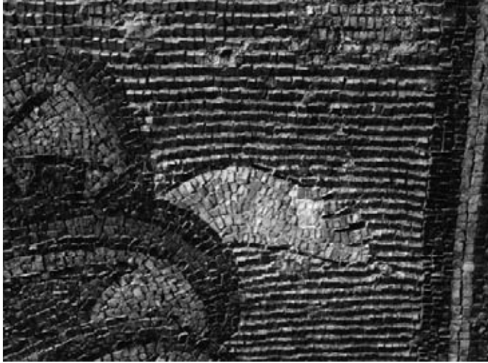
11. Les tesselles à lames métalliques utilisées pour l'arc triomphal, elles sont inclinées vers le bas de 45°