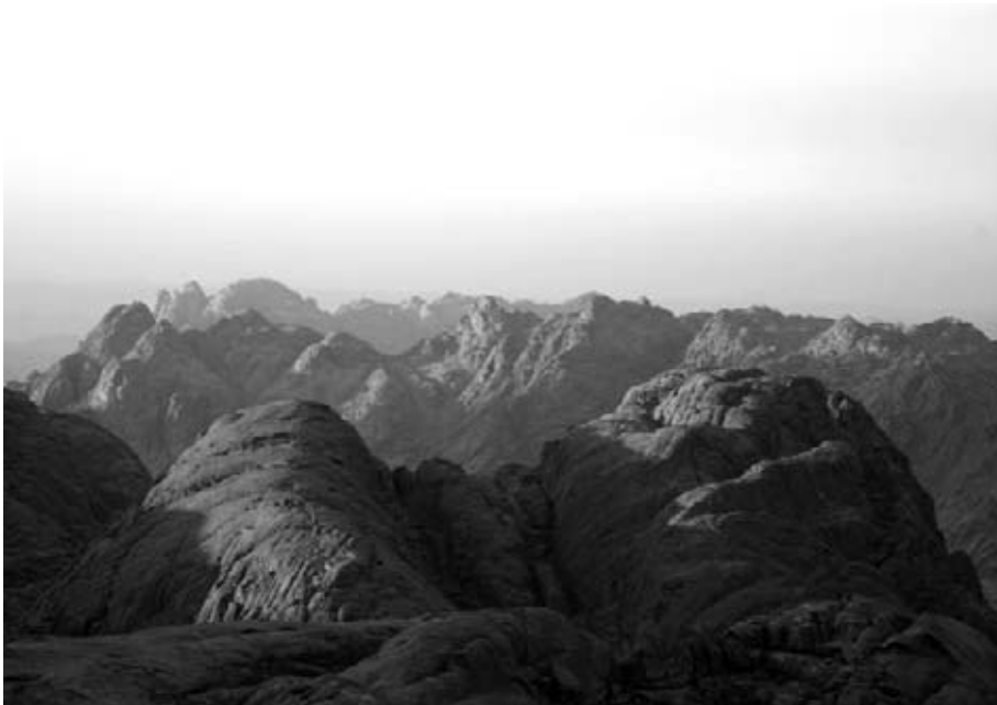
2. La chaîne montagneuse de la péninsule du Sinäi