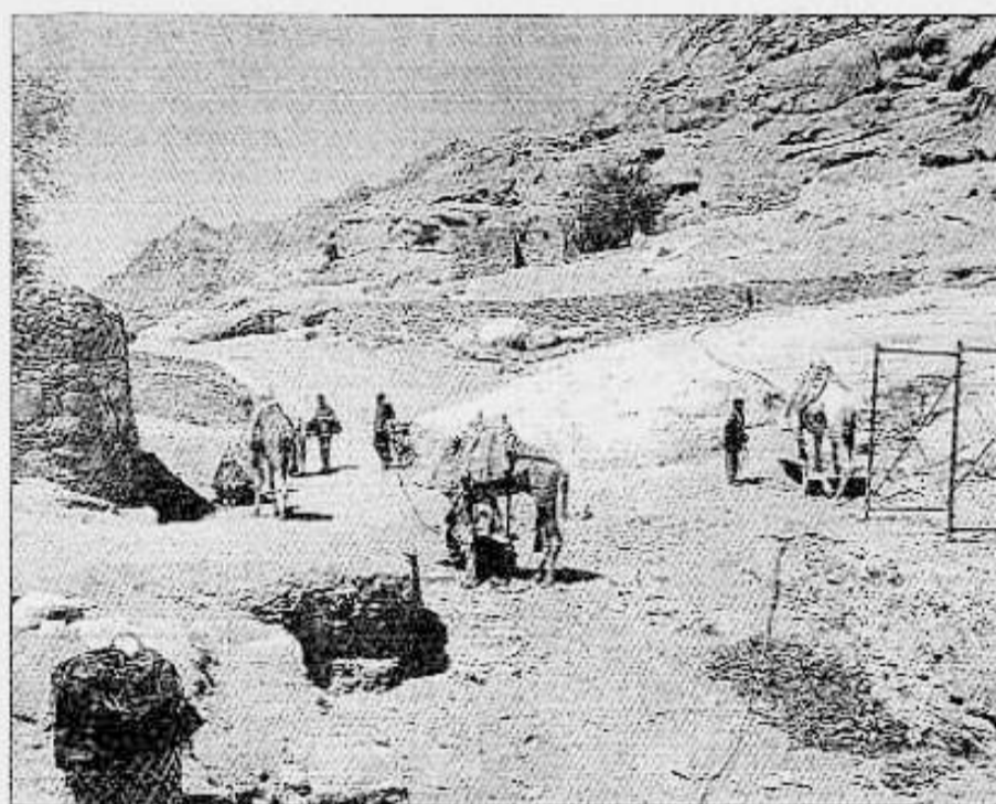
Η βεδουϊνική φυλή των Γκεμπελίγια (βουνισίων) – που «ανήκει» στη Μονή... διαχειρίζεται και την ανάβαση με καμήλες στην κορφή του Μαουσί.

ΓΕΜΑΤΑ ΔΕΚΑΡΑΚΙΝΑ και βουτιάσε από Ειρηναίους το φυσιολόγο στη μύτη του Σινά Πέτρο Σαυμ Ελ Σείχ, όπου προσηλώθηκε το αεροπλάνο μας. Πήραμε να αναφορίζουμε με την Ερυθρά Θάλασσα οριστερά και δεξιά τα βουνά-κίβνια του Σινά, που στην καρδιά τους φυλάττει η μονή. Αφού περάσαμε την παραβίαση αρχαία Ραϊβό (σημερινό Τορ), όπου επισκεφθήκαμε έναν ημιπάλοιο Άγιο Γεώργιο, στρίψαμε δεξιά προς το κέντρο της κερσονήσου, όπου ο δρόμος ακολουθεί αρχαία περάσματα